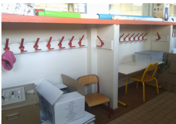
Couloirs école Édouard HERRIOT

Concernant les locaux, est également évoquée la prolifération de cafards, particulièrement en salle des maîtres. Au jour de la rédaction du compte-rendu, une entreprise de désinsectisation est une nouvelle fois intervenue le 18/03, ce qui a perturbé l'accueil des élèves en raison de l'odeur du produit utilisé (solvant filmogène spécifique). M. DAIRON indique que l'entreprise repassera dans un délai de trois semaines. Le mobilier a été déplacé pour traitement, le ballon d'eau chaude déposé, emmené (et non remplacé au jour de la rédaction du compte-rendu). Ce problème remet à l'ordre du jour une demande de création de placards à portes coulissantes dans le couloir longeant la salle des maîtres, en lieu et place des niches à porte-manteaux. Cela a été effectué à l'école Jean ZAY (sur un bâti très semblable, pour ne pas dire identique) et permettrait de faciliter le rangement (et donc l'entretien) de la salle des maîtres.