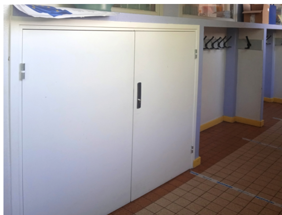
Couloirs école Jean ZAY

Ces deux dernières problématiques (chauffage et cafards) ont fait l'objet de fiches portées au registre « Santé et Sécurité au Travail » de l'école, qui n'ont pas reçu d'autres réponses que celles formulées par le directeur (transmission aux services techniques de la mairie de Villeurbanne). Les parents d'élèves élus appuieront les demandes des enseignants.